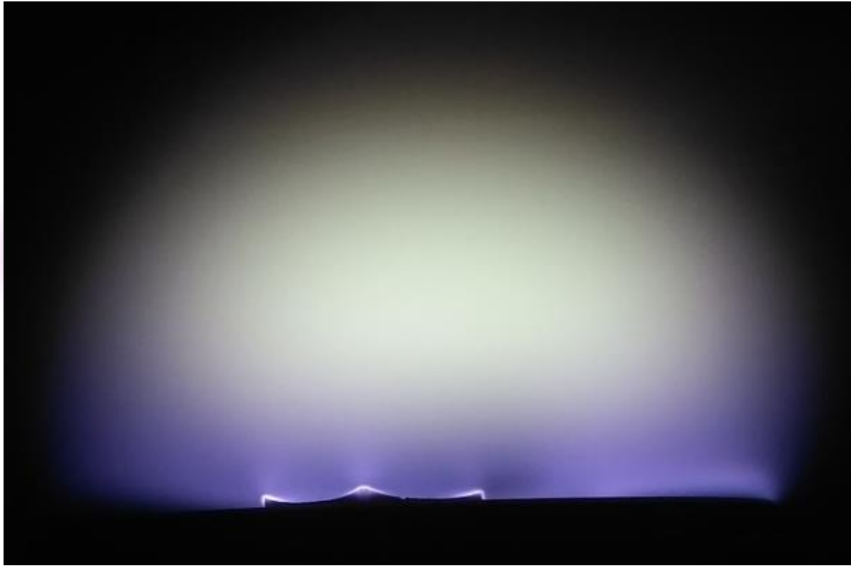
Схема осаждения алмаза на подложку